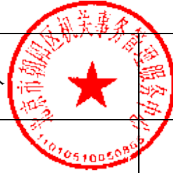
申请人商务信息公示表